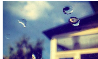
Киев накрыло ливнем, соцсети - восторгом