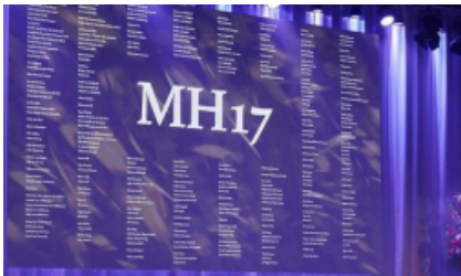
"Офицер СБУ" в кабине Бука. Кремлевская пропаганда явила миру театрализованный фейк о виновниках крушения МН17