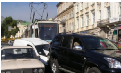
Трамвай и легковушка устроили крупное ДТП во Львове с эффектом домино