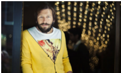
50 советов миллионера Чичваркина о том, как делать бизнес в постсоветских реалиях